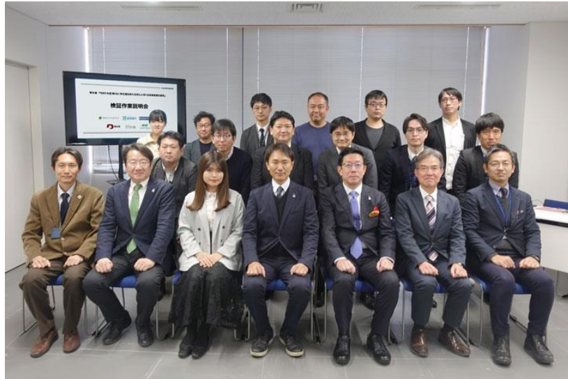
参加団体向け検証作業説明会を実施